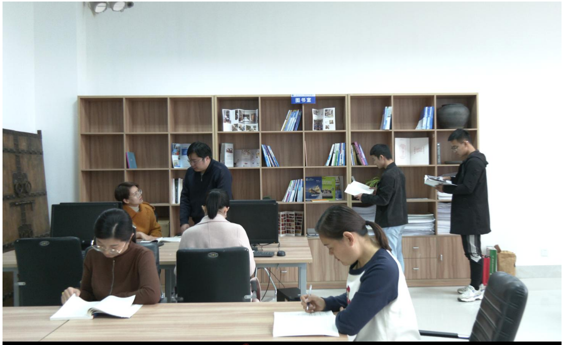
图 5-1 图书室资料

5 图书资料 建设了 100 余册水利电子图书及纸质图书,拥有专门的图书资料室。