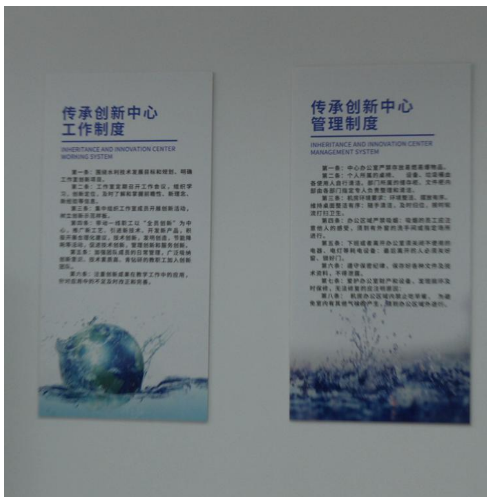
图 3-3 工作室制度建设