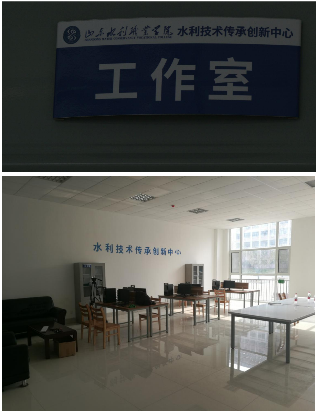
图 3-1 工作室