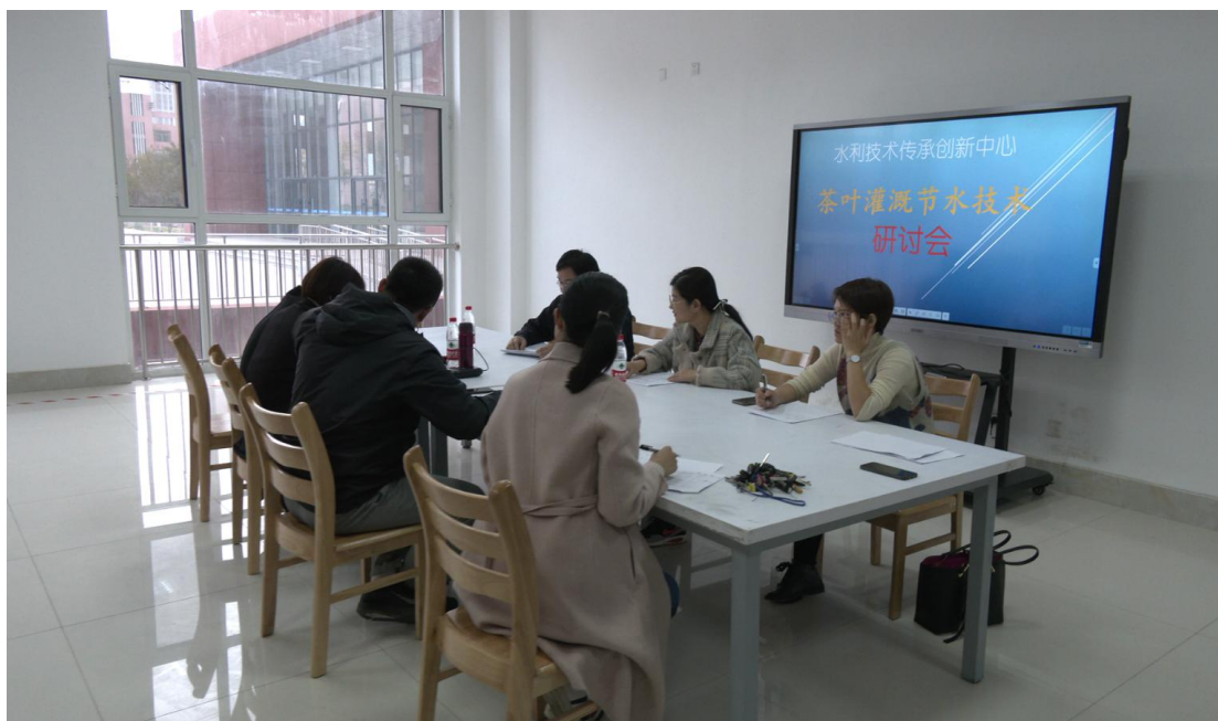
图 3-2 会议室一角